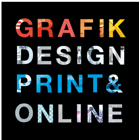
Die Wortmarke „Grafikdesign Print & Online“ ist das Markenzeichen von mw gestaltung & kommunikation. Unten: Die Homepage

Ich stelle mich als mw gestaltung & kommunikation in einem einheitlichen Erscheinungsbild dar. Aus der Wortmarke „Grafikdesign Print & Online“ leitete ich alle Bestandteile des Corporatae Designs ab. Es besteht aus einer Homepage, Imagefolder, Visitenkarten, Briefbogen und Briefkuvert. Auf ein einheitliches Erscheinungsbild habe ich sehr großen wert gelegt.