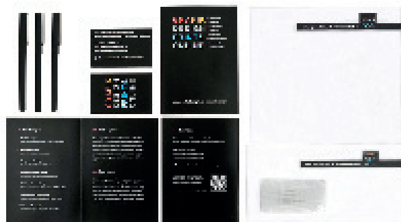
Die Drucksachen von mw gestaltung & kommunikation, bestehend aus Imagefolder, Visitenkarten, Briefbogen und Briefkuvert werden für Werbetriebe, Angebote, Rechnungen etc. eingesetzt.